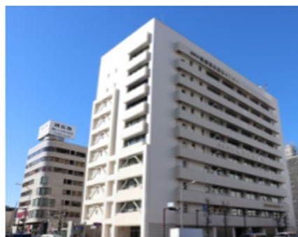
横浜市社会福祉センター